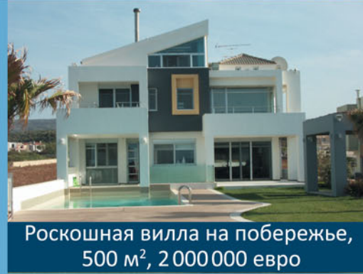
Роскошная вилла на побережье, 500 м 2 , 2 000 000 евро