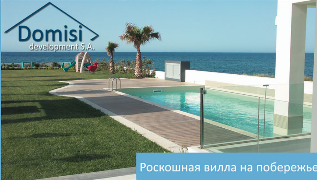
Роскошная вилла на побережье