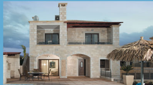
Роскошная вилла, 180 м 2 , 530 000 евро