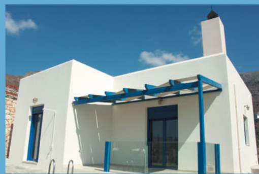
Бунгало, 66 м 2 , 125 000 евро