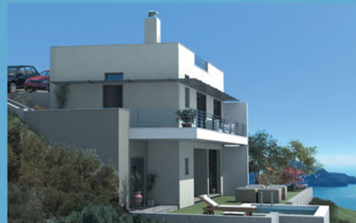
Апартаменты, 62 м 2 , 190 000 евро