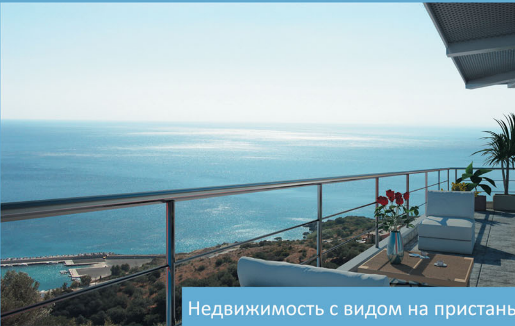
Недвижимость с видом на пристань