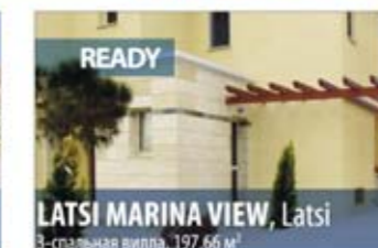
LATSI MARINA VIEW, Latsi 3-спальная вилла, 197.66 м 2

Комплекс Latsi Marina View состоит из 19 эксклюзивных вилл и 2 бунгало, расположенных в престижном районе рядом с морским побережьем Лачи, на границе с национальным заповедником Акамас. Из великолепных 3-спальных вилл открывается прекрасный вид на море и окрестности. Просторные гостиные/столовые открытого плана, расположенные на первых этажах вилл, имеют выход на веранду с видом на бассейн и сад. Здесь Вы сможете в полной мере насладиться средиземноморским образом жизни.