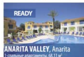
ANARITA VALLEY, Anarita 1-спальные апартаменты, 68.11 м 2

Апартаменты Таунхаусы Виллы ИНДИВИДУАЛЬНЫЕ ПРОЕКТЫ