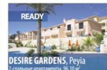
DESIRE GARDENS, Peyia 2-спальные апартаменты, 96.10 м 2

Desire Gardens располагается в замечательном районе с прекрасными видами на Средиземное море недалеко от деревни Пейя, в окрестностях Пафоса. Проект занимает огромную зеленую территорию с красивейшими пейзажами. Большой плавательный бассейн - идеальное место для отдыха и наслаждения превосходным средиземноморским климатом и образом жизни. Из всех квартир открываются панорамные виды на море. В некоторых квартирах есть отдельные бассейны, расположенные на крыше, или джакузи на открытом воздухе в разбитом на крыше саду.