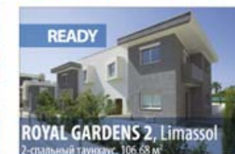
ROYAL GARDENS 2, Limassol 2-спальный таунхаус, 106.68 м 2

В комплексе Royal Gardens 2 Вы сможете насладиться удобством и роскошным дизайном двухспальных таунхаусов, спроектированных с учетом потребностей современного образа жизни. Дома расположены в окружении садов, созданных умелыми дизайнерами, в одном из лучших жилых кварталов в самом сердце космополитичного Лимассола. Комплекс Royal Gardens 2 удачно расположен всего лишь в 500 м от песчаного пляжа и теннисной аллеи. Высокие потолки, большие веранды с выходом в частные сады.