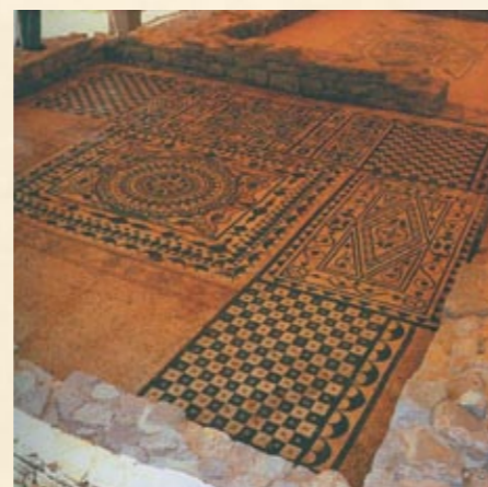
Пример напольной мозаики в римском жилом доме, конец II века н. э.

Очевидно, что визуальный эффект — воздействие света и цвета — имеет при строительстве замка первостепенное значение. Ведь умение оперировать отвлеченными формами — это способ стилизовать идею, историю, миф. Эстетическое осмысление жизни человека лежит в сфере как вербальных, так и невербальных связей, поэтому от архитектора, строителя, каменщика зависит, по сути, достигнет ли человек связи с местом своего про-