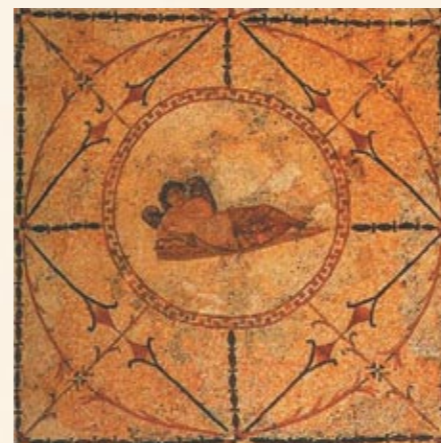
Мозаика в римской вилле, II век н. э. Изображение бога сна Гипноса

живания или нет, ведь сакральная архитектура должна преобразовывать жизнь человека, упорядочивать его природу.