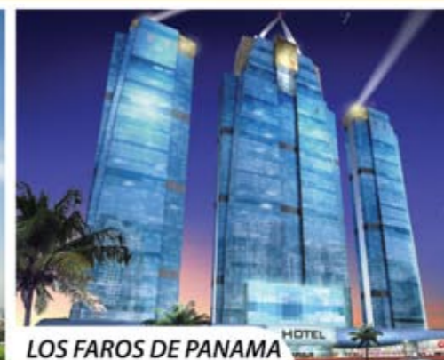
LOS FAROS DE PANAMA