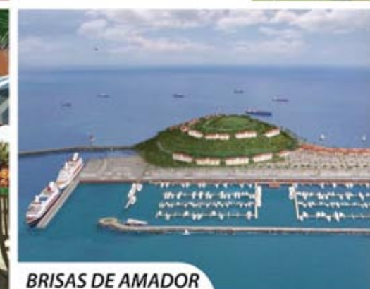
BRISAS DE AMADOR