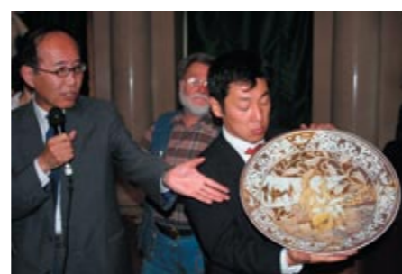
Организаторы: KASUMI, PR-агентство «Королевские игры».