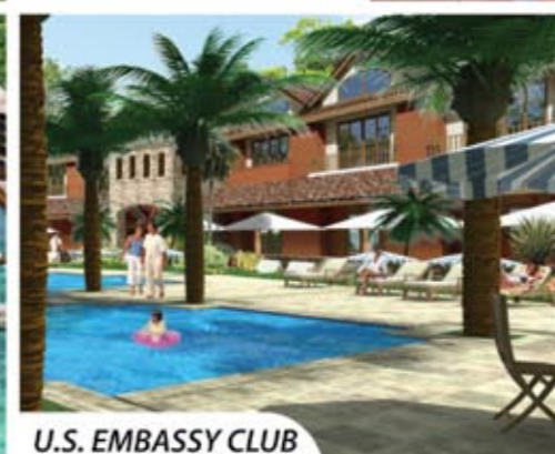
U.S. EMBASSY CLUB