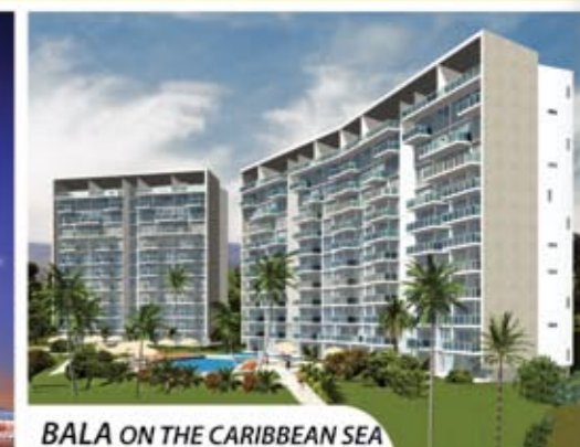
BALA ON THE CARIBBEAN SEA