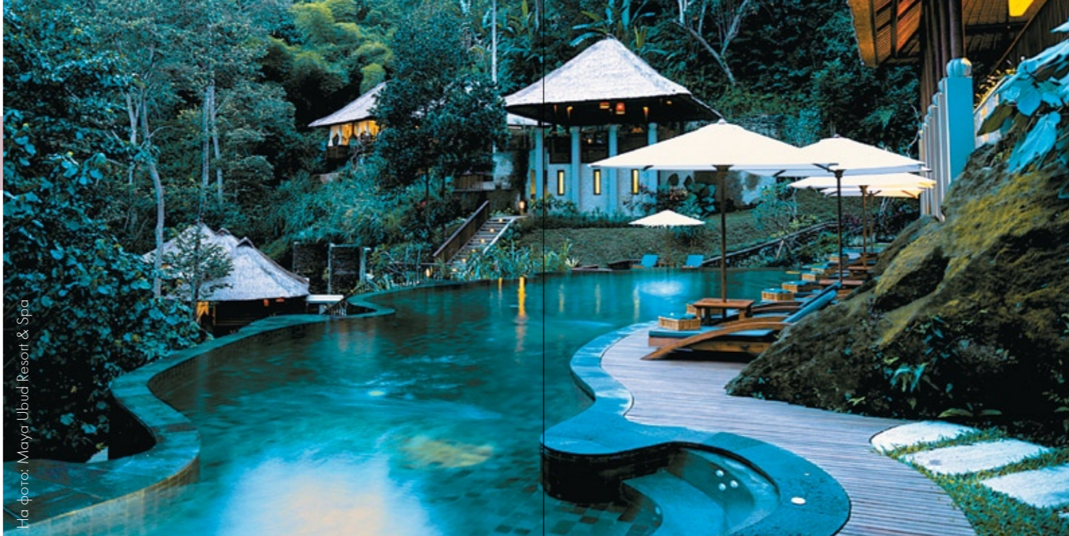
На фото: Maya Ubud Resort & Spa

Курорт расположен на прибрежной скале, откуда открывается панорамный вид на Индийский океан. Элитная процедура "La Mer" относится к разряду настоящих сокровищ терапии. Здесь вас ждут и другие превосходные процедуры талассотерапии, такие как Aquatonic® – терапевтический бассейн с морской водой, гейзеры, подводный спортивный зал, павильон с пузырьковым душем. Все это отвечает мировому классу и вызывает восхищение.